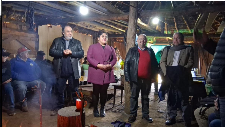
Imagen 5. Noticia referida al encuentro