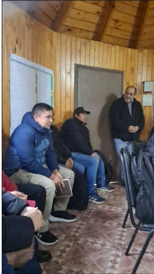
Imagen 6. Reunión de trabajo en sede social del Lof Truf-Truf